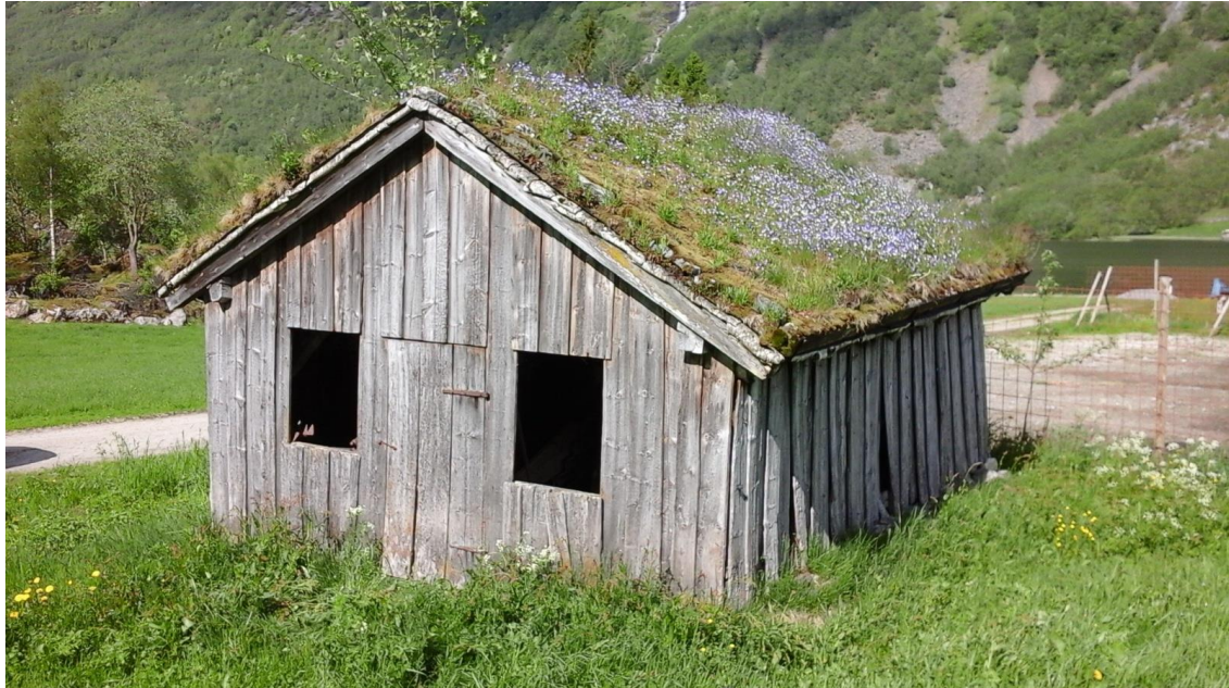
Smie i Knutgarden på Helset i Sunnylvn.

I det gamle bondesamfunnet vart det meste laga heime på garden. Nokre produkt var likevel så avanserte at det var behov for å byte til seg varene, eller få hjelp av særskilt nevenyttige kvinner og menn. Dette var handverkarar som t.d. skomakarar, smedar og skreddarar.