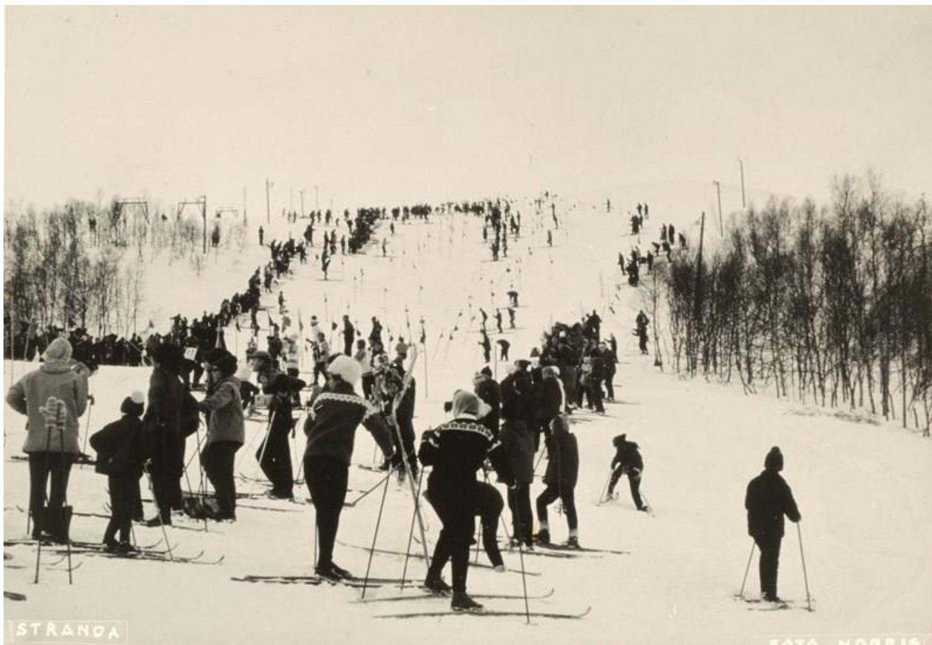
Skirenn på Strandafjellet ca. 1958 Postkort