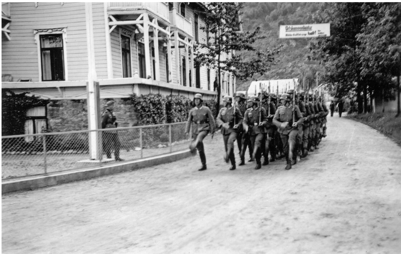
Tyske soldatar passerer Grand Hotell