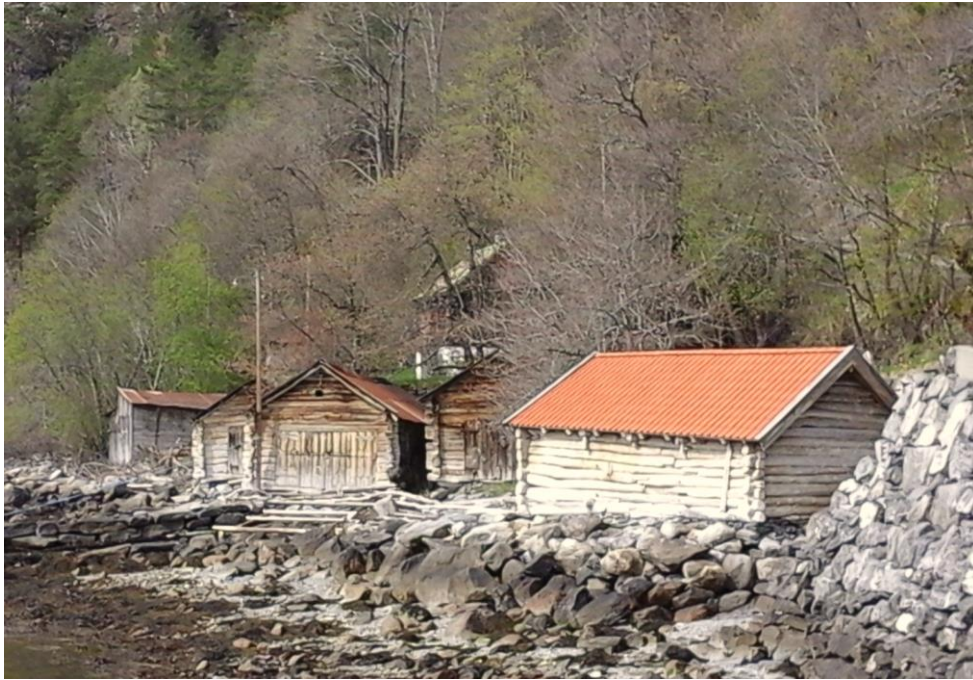
Naustrekka ved Liasjøen

I Stranda kommune er det 11 naustmiljø med til saman om lag 70 naust i varierende tilstand. Alt frå tidlege tider har folket i vår kommune ferdast på fjorden. Robåtar av alle slag har vore i bruk for å frakte folk, dyr og varer. Det har vore naudsynt å ha naust for å ta vare på båtane. Dei nausta som no står att, er verdfulle kulturmiljø, som vi må stimulere eigarane til å halde i stand.