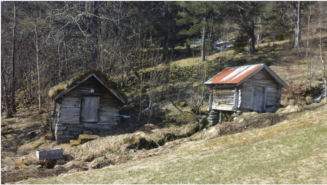
Tørkestove og kvernhus, Øggarden på Ringset i Liabygda.