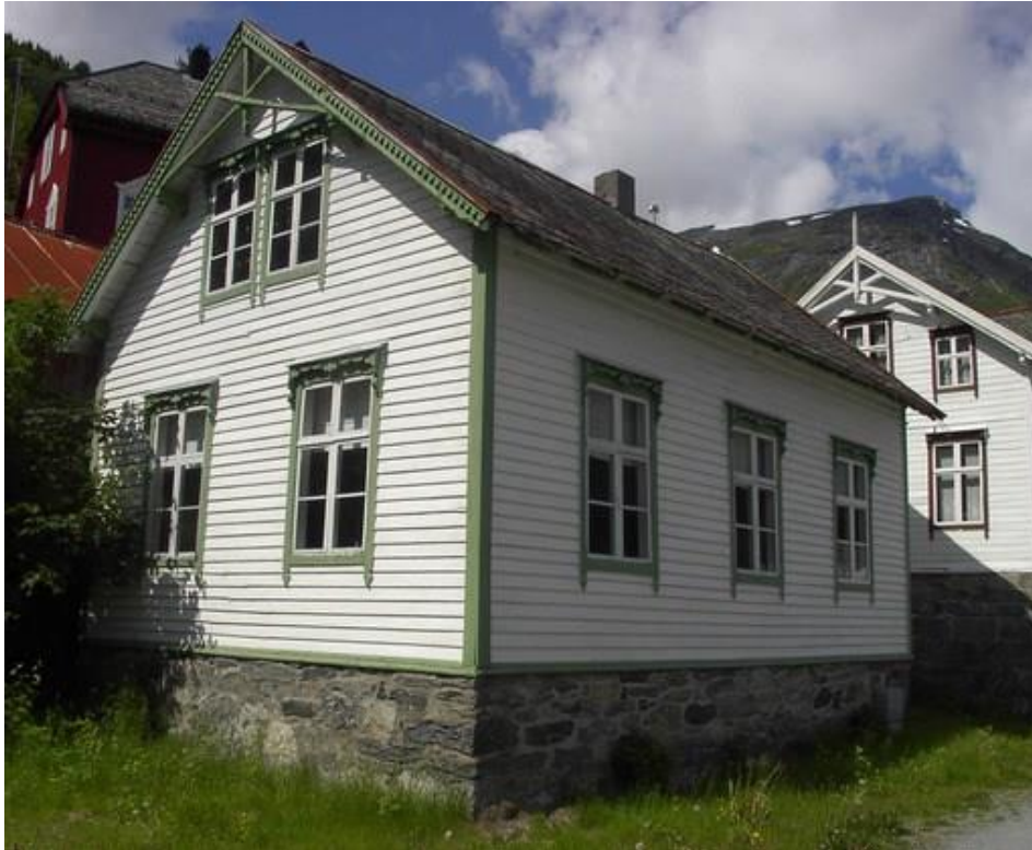
Hellesylt skule (1898-1956)

har i dag om lag 200 elevar, dei fleste frå Stranda, Norddal og Stordal kommunar, og han har tilbod innan studiespesialisering, idretts- og yrkesfag.