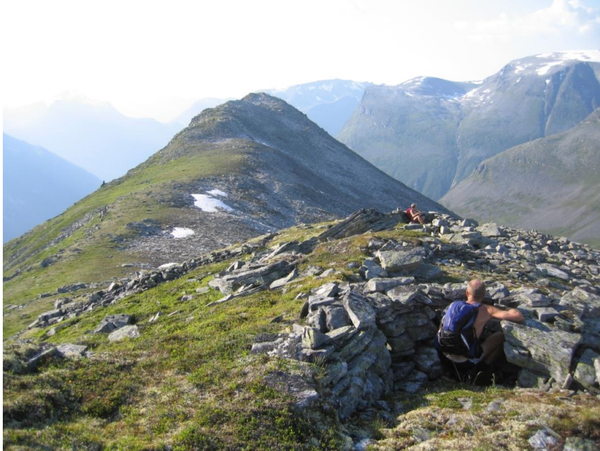
Bogestillingar på Vinsåshornet.

Gravhaugar og rydningsrøyser finn ein i alle bygdelag i kommunen. På garden Opsvik på Stranda er restane etter den første kyrkja på Stranda frå 1000-talet framleis godt synleg. I alle bygdelaga er det funne mange lause fornminne.